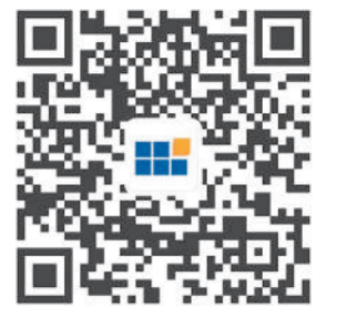
河南六建微信公众号(扫码关注)