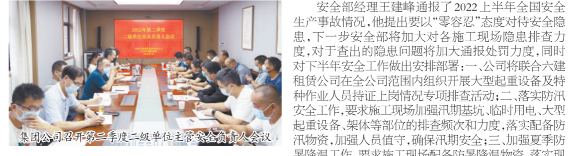
集团公司召开第二季度二级单位安全负责人会议

7月22日下午,集团公司五楼会议室召开2022年第二季度二级单位安全负责人会议,集团公司安全部及各二级单位主管安全负责人共40余人参加会议。会议首先传达学习2022年7月11日全国安全生产电视电话会议精神及国家、省、市关于安全生产工作的重要指示精神,分析当前安全生产形势,安排部署下半年公司安全重点工作。会上通报了集团公司第二季度各施工现场安全检查存在的主要问题,并对各施工现场隐患部位照片、安全检查及贯标内审考核排名情况、双重预防体系应用检视考核统计及企业智能监控系统应用问题等进行分析通报。