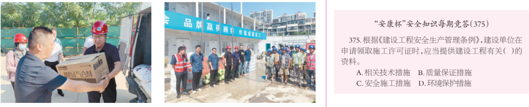
将慰问品送到一线员工手中 慰问洛阳天澜花园项目一线员工

7月21日上午,集团公司开展“夏送清凉、传递关爱”慰问一线员工活动。党、政、工有关人员先后来到万安山医院、都会龙园、中南高科、洛阳智能装备创新港、天澜花园、玄武门大街项目等工程现场,为一线员工送去绿豆、白糖、西瓜、矿泉水、方便面、毛巾、藿香正气水等消暑降温物品,并对在酷暑天气下仍奋战一线的建设者表达集团公司的关爱之情。今年入夏以来,持续高温天气对项目安全生产提出了更高要求,公司在建项目根据工程建设需要,克服高温酷暑等实际困难,采取错峰施工、加强人员防暑保护措施,有力保障了项目施工正常开展。集团公司工会也下发加强防暑降温 and 安全生产监督检查工作的通知,并开展夏季慰问活动,切实保障一线员工安康。慰问组一行在施工现场将防暑降温用品送至一线员工手中,并详细询问了各工程施工情况,叮嘱大家做好夏季防暑降温工作,预防极端天气等因素带来的安全隐患,做好疫情防控,确保安全生产。项目部人员对集团公司的关爱表达了由衷感谢,并表示一定将坚守安全底线,全力以赴完成施工任务。(综合办)