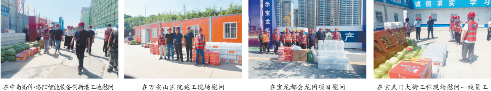
在中南高科、洛阳智能装备创新港工地慰问 在万安山医院施工现场慰问 在宝龙都会龙园项目慰问 在玄武门大街工程现场慰问一线员工