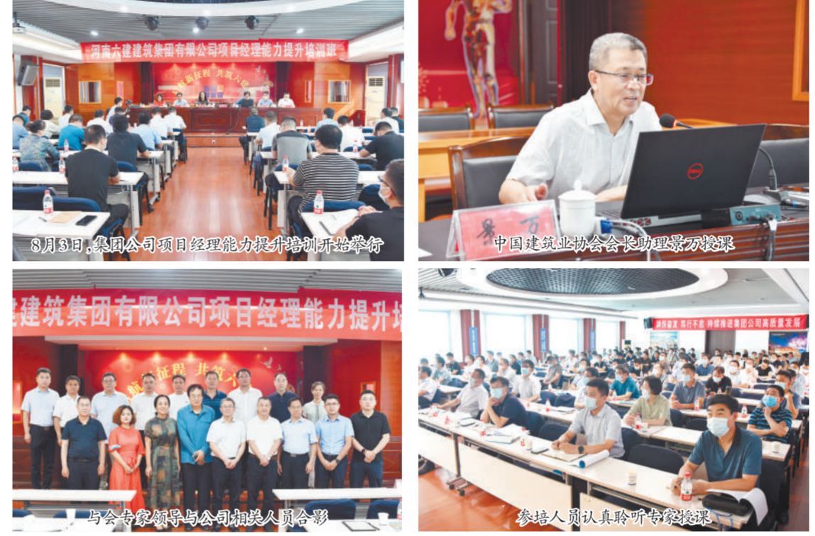
8月3日,集团公司项目经理能力提升培训班开班举行 与会专家领导与公司相关人员合影 参训人员认真聆听专家授课

为推进企业人才培养落地实施,进一步加强项目经理队伍建设,着力提升项目经理的政治理论水平和业务工作能力,加快推进项目经理职业化建设进程,8月3日-4日,集团公司特邀中建协项目管理培训中心在六楼会议室举办项目经理能力提升培训。 中国建筑业协会会长助理景万、中国建筑业协会专家冯跃、李娟、王文秀、张广志等领导莅临集团公司授课并指导工作。公司领导班子成员、职能部门负责人、分公司经理、项目经理(执行经理)、主任工程师等近300人参加此次培训,19个分会场通过远程视频方式参与培训。 8月3日上午,培训班举行开班仪式,中建协项目管理培训中心副主任王超慧主持开班仪式,集团公司副总经理郭向阳作动员讲话。