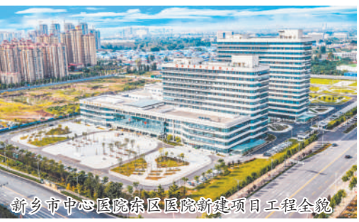
新乡市中心医院东区医院新建项目工程全貌